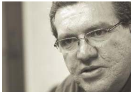
Quieren dar transparencia a las licitaciones, aseguró el titular de Obras Públicas.

El trabajo de la secretaría se basará en un calendario, para tener un orden, también se buscarán los horarios que ocasionen menos caos vial y considerarán los materiales que sean ecológicos o menos dañinos para el